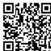
Invia richiesta di inserimento in classifica

AVVISO: Quando si invia una protesta, una richiesta o un rapporto, la procedura rimane invariata (come da Regole di Regata e Istruzioni di Regata).