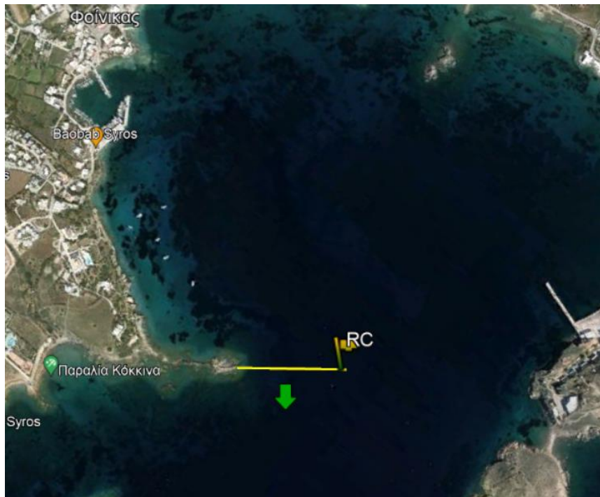
ΕΚΚΙΝΗΣΗ 1 ης ΙΣΤΙΟΔΡΟΜΙΑΣ (ΦΟΙΝΙΚΑΣ – ΕΡΜΟΥΠΟΛΗ)