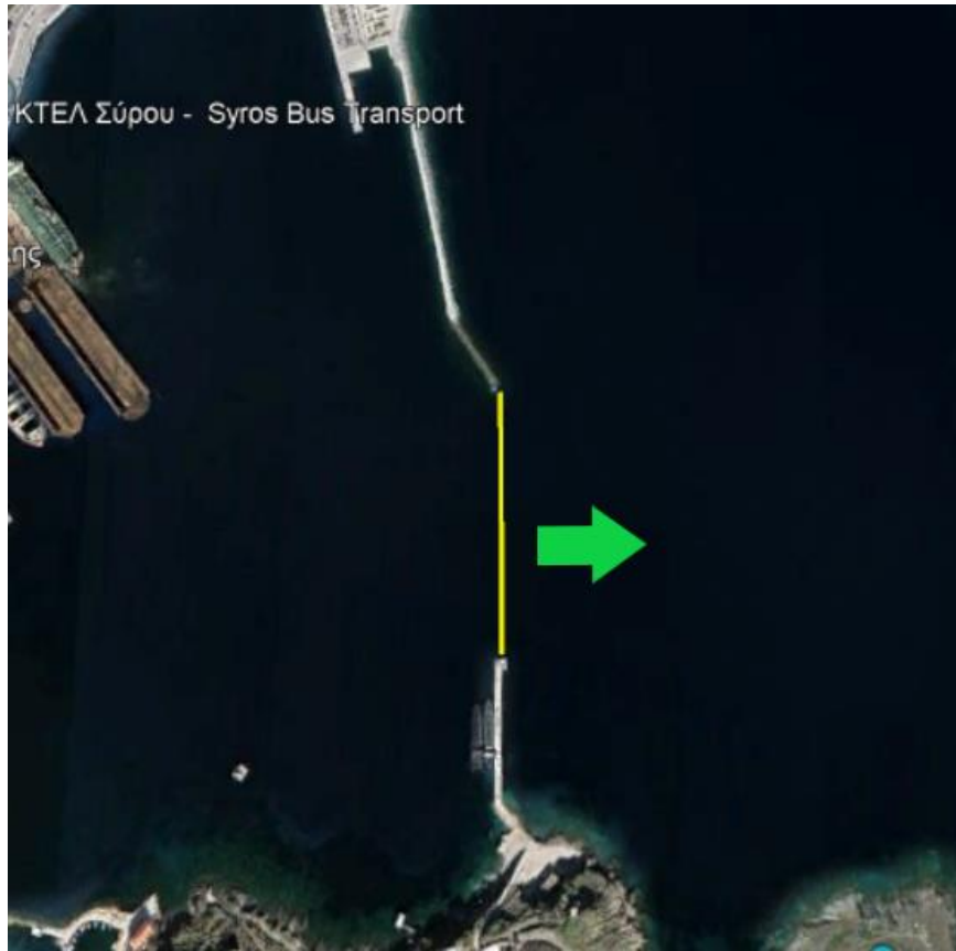
ΕΚΚΙΝΗΣΗ 2 ης ΙΣΤΙΟΔΡΟΜΙΑΣ (ΕΡΜΟΥΠΟΛΗ – ΦΟΙΝΙΚΑΣ)