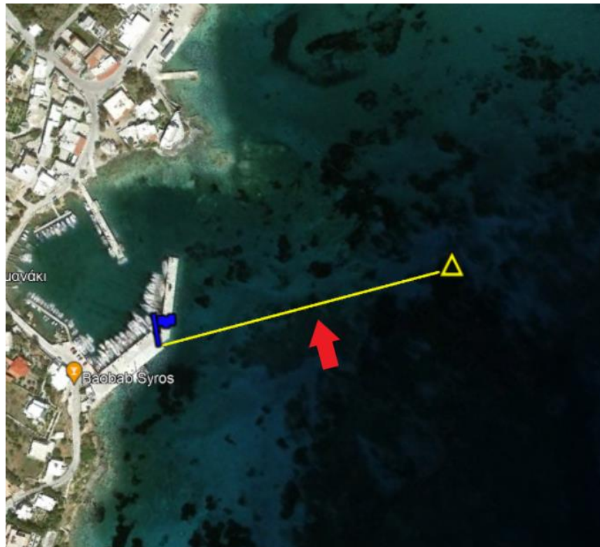
ΤΕΡΜΑΤΙΣΜΟΣ 2 ης ΙΣΤΙΟΔΡΟΜΙΑΣ (ΕΡΜΟΥΠΟΛΗ – ΦΟΙΝΙΚΑΣ)