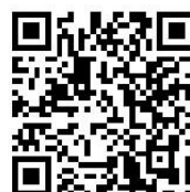
Submit Scoring Inquiry

NOTICE: When submitting a protest, request or report, the procedure (as set forth in the Racing Rules of Sailing and the Sailing Instructions) remains unchanged.