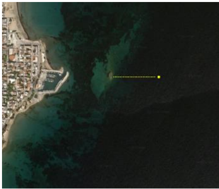
Διαδρομή 16 Σεπτεμβρίου