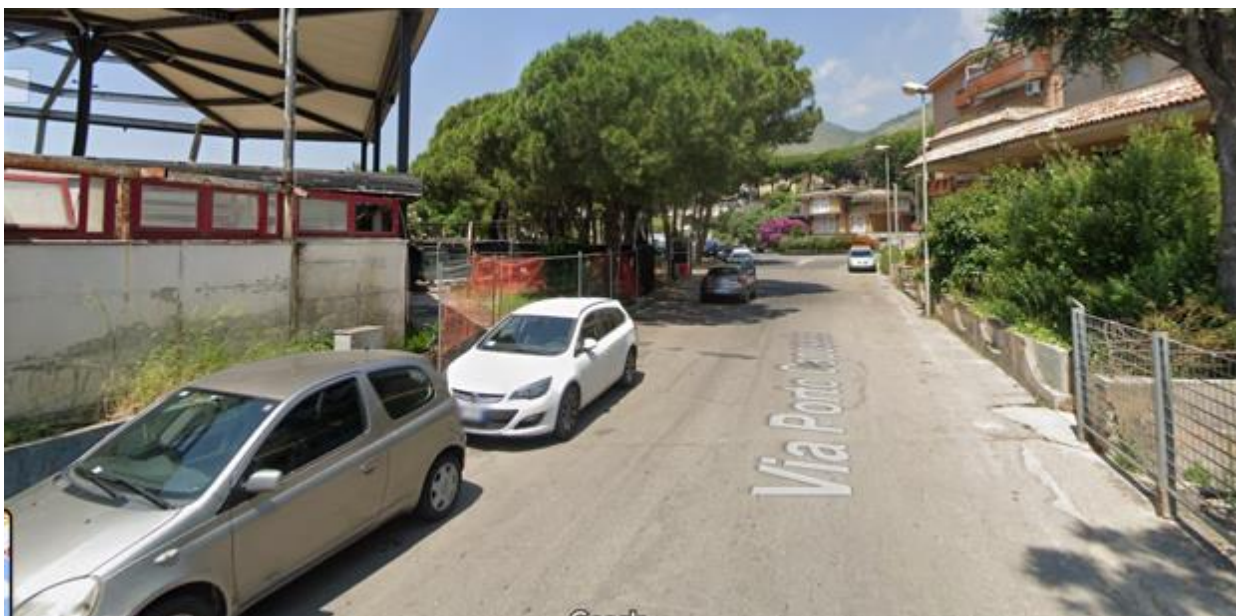
Via porto caposele