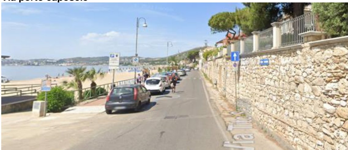
Via Tito Scipione