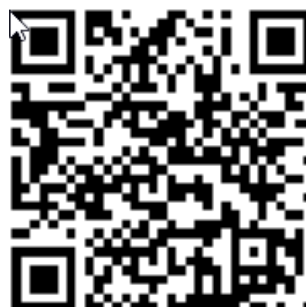
Albo Ufficiale dei Comunicati 12 luglio

Il sistema tradizionale con modulistica cartacea resta comunque a disposizione presso la segreteria di regata per chi avesse difficoltà di accesso.