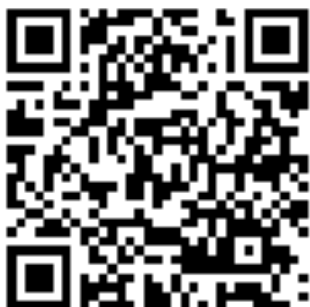
Albo Ufficiale dei Comunicati 11 luglio

(v. QR-code di seguito per utilizzo da apparato mobile)