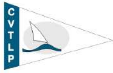
Circolo Velico Torre del Lago Puccini