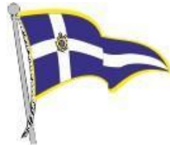
LNI Sezione di Procida