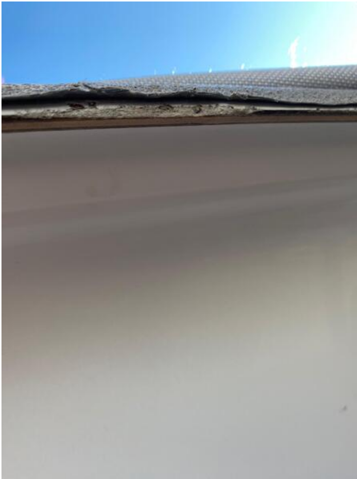
IMG-20230908-WA0004.jpg 57.9 KB