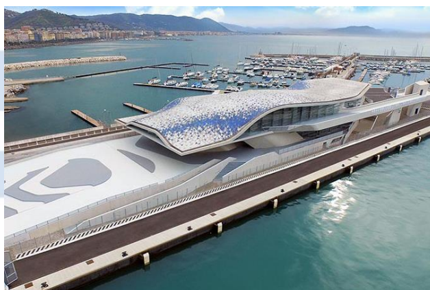
Stazione marittima di Salerno

L'orario della cerimonia di premiazione verrà comunicato con un prossimo Comunicato.