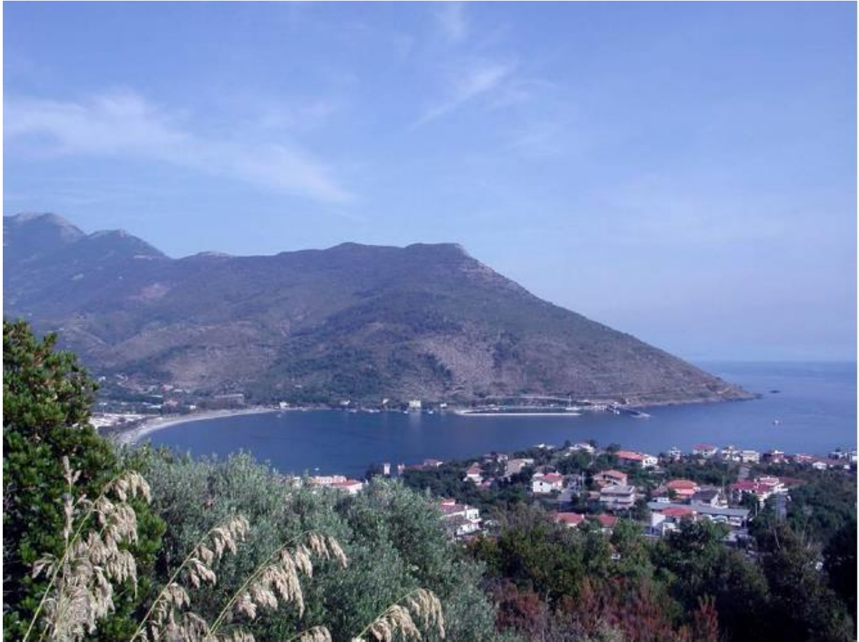
Baia di Sapri