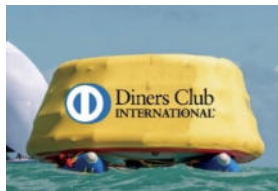
マーク 1、マーク 2