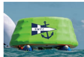
コース変更時マーク 1に 置き換わるブイ