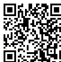
Invia richiesta di inserimento in classifica

AVVISO: Quando si invia una protesta, una richiesta o un rapporto, la procedura rimane invariata (come da Regole di Regata e Istruzioni di Regata).