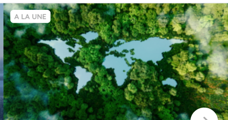
Formation à distance sur le changement climatique en mars