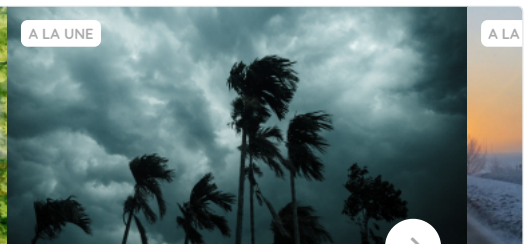
Belal a touché La Réunion

Le cyclone tropical BELAL est situé le lundi 15 janvier 2024 à 13h locales vers la côte est de l'île. Il se déplace