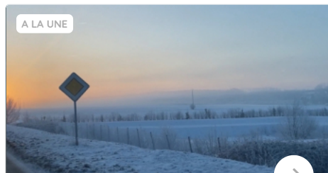
Froid, neige, verglas : un épisode hivernal rare dans le climat actuel; redoux à partir de dimanche