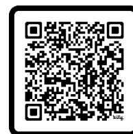
Boletim Insc. Online