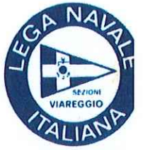
LEGA NAVALE ITALIAI